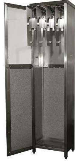
YIBTECH END- 04 PASLANMAZ ÇELİK ENDOSKOPI DOLABI