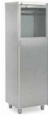
YIBTECH YKD-01 KATATER DOLABI

304/4N paslanmaz çelikten üretilmiştir. Eveye profil ayaklar üzerinde durur. Tek evyelidir.