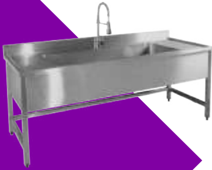
YIBTECH ST EY ENDOSKOPI YIKAMA EVYESİ

END-205 ÜRÜN YAPISI: Altı adet endoskop kurutma ve muhafaza imkanı. Çalışmaları ayrı ayrı iki ayrı kompartmanda yapılabilir, ekran üzerinden ayarlanabilir.