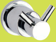
SR L 5000

1600 W 2 üfleme 3 sıcaklık ayarı, ılık hava özellği, duvar ünitesinde on/off düğmesi Traş prizi 110-120V ve 220-240V