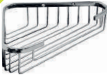
SR L S 024