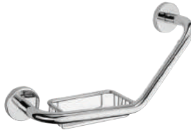
SR L 5024