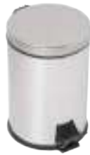
YIBTECH A 331 E

304/4N pedallı çöp kovası, paslanmaz çelikten üretilmiştir. Hacim: 5 lt.